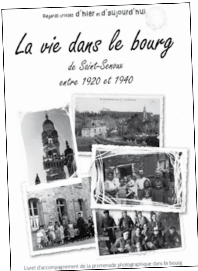
Livret d'accompagnement de la promenade photographique dans le bourg

Livret disponible à la mairie et sur le site internet www.saintsenoux.fr