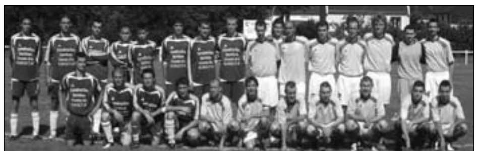
L'équipe A victorieuse de VEZIN le COQUET. 1er tour de coupe de France.

La saison 2010/11 a déjà repris pour le Sporting Club de Saint Senoux. En seniors, trois équipes sont à nouveau engagées dans les championnats de District et une équipe vétérans en association avec Pléchatel. L'effectif global est encore en hausse puisqu'il devrait atteindre 70 licenciés seniors-vétérans